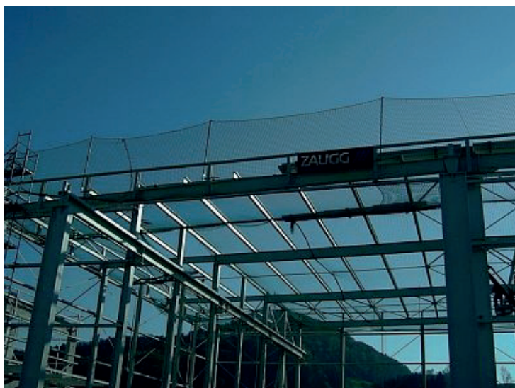
Liebherr, Reiden Schweiz

Bei der Verlegung von Dachelementen sowie bei sonstigen Dachbauarbeiten im Hallenbereich tritt neben der Absturzsicherung nach innen (ins Bauwerk) auch das Problem einer Dachrandabsicherung nach aussen auf. Wir montieren zur Absicherung von Dächern bis 20 Grad Neigung eine Randsicherung in Verbund mit Seitenschutznetzen gemäss EN 1263-1 an Beton- und Stahlträgern. Für individuelle Lösungen bitten wir um Anfrage.